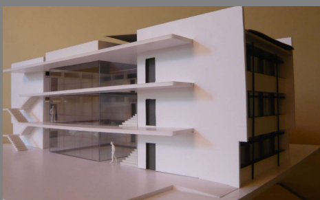
Obra: Escola Alcaides Faria Local: Barcelos Ano: 2009-2010 Função: Projetista

pretendemos conquistar a confiança de todos os nossos clientes, sendo este um sentimento nobre e basilar para a filosofia da nossa empresa.