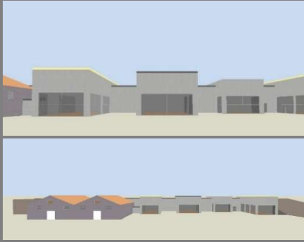
Obra: Creative Box Local: Óbidos Ano: 2012-2013 Função: Projetista