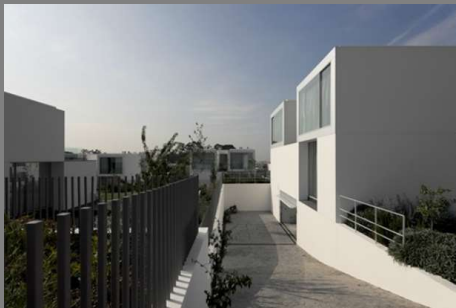
Obra: Igreja e Centro Escolar (Área de Implantação de 3000m 2 ) Local: Liro, Angola Ano: 2012 Função: Projetista